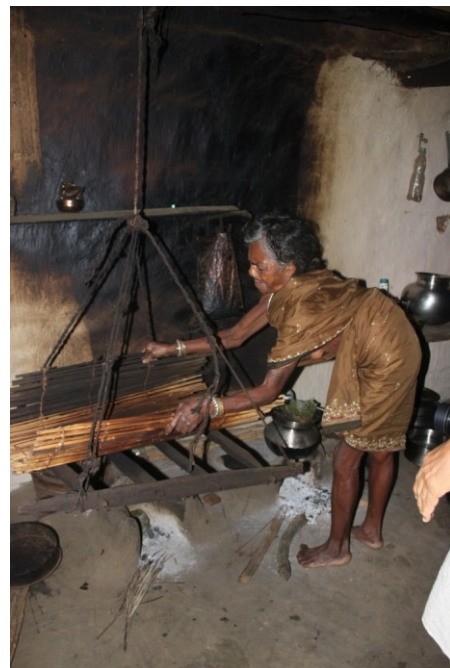
मछली, मिर्ची और मशरूम आदि को धुआं लगाने के लिए चूल्हे के ऊपर बांस के ढाँचे पर रखा जाता है

जंगलों से खाने की चीजें इकट्ठी करने के साथ-साथ आदिवासी छोटे जानवरों का शिकार भी करते हैं. चिड़ियाएँ, जंगली मुर्गे, मेंढक, चूहे, गोह, खरगोश के साथ-साथ वे कभी-कभी बंदरों, जंगली बिल्लियों, कुत्तों और जंगली लोमड़ियों का भी शिकार करते हैं. इलाके में बहुत तालाब और नदियाँ हैं जहाँ से वे सिंघाड़े, मछलियाँ, केंकड़े, झींगा, घोंघे आदि इकट्ठा करते हैं. जो आहार बचता है विशेषकर मशरूम, मछली, गोशत और मिर्च उसे बांस से लटकाकर चूल्हे का धुआं दिखाया जाता है. बाद में या तो उसे खाया जाता है, पड़ोसियों को भेंट किया जाता, या फिर पैसों की ज़रूरत पड़ने पर उसे बेंच दिया जाता है.